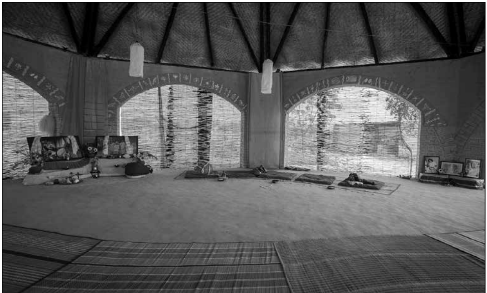
Sanatan Siddhashram, 2019.