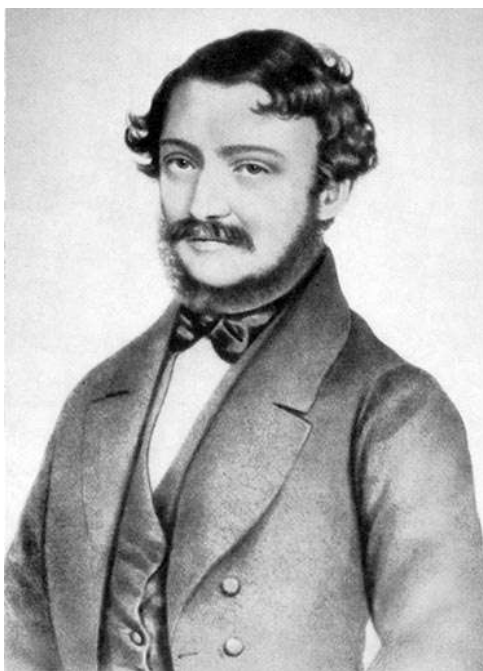
A fiatal Erkel Ferenc portréja