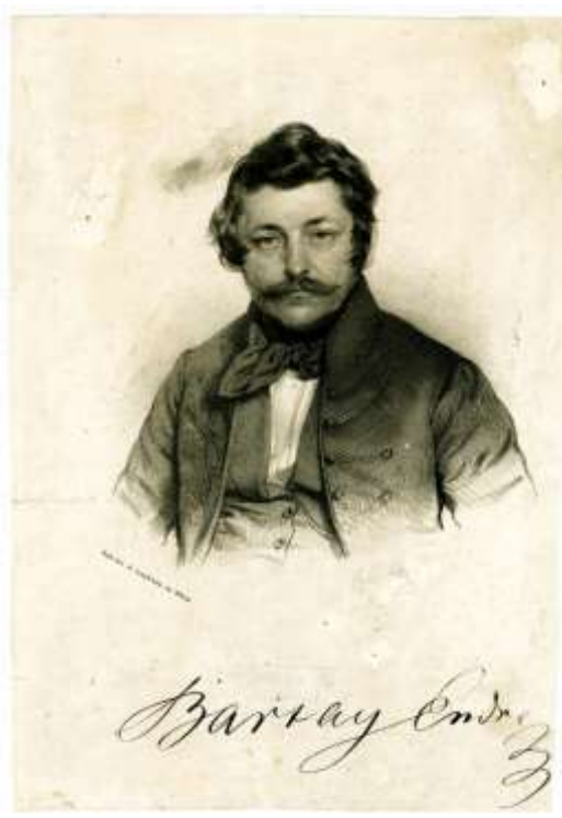
Bartay Endre 1841-ben